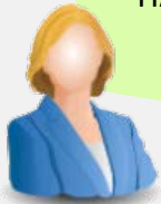
AO § 24 LMSVG