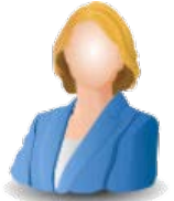
Behörde (LMA od. VET)